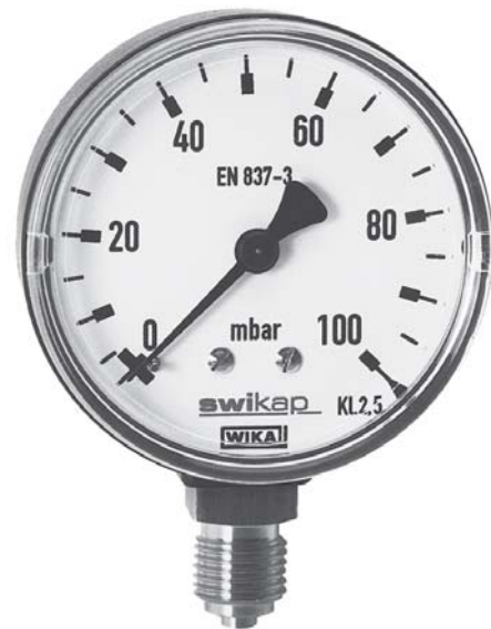
Манометр с коробчатой пружиной