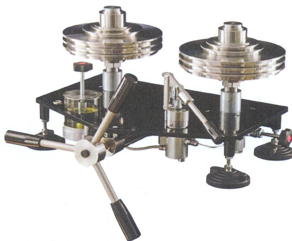
Рис. 2 Манометры грузопоршневые МП (УСД специального исполнения)