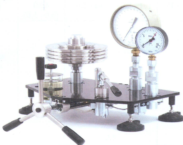
Рис. 1 Манометры грузопоршневые МП (УСД обычного исполнения)

УСД обычного исполнения имеет два места для установки поверяемых (калибруемых) приборов. УСД специализированного исполнения имеет одно место для поверки ИПС грузопоршневого манометра и снабжено устройством для наблюдения за положением поршней. В зависимости от диапазона измерений манометры выпускаются в 6 модификациях в соответствии с таблицей 1.